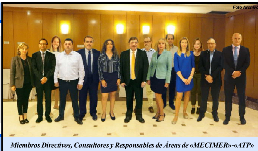
Miembros Directivos, Consultores y Responsables de Áreas de «MECIMER»-«ATP»