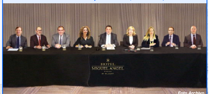
Composición Rectora-Consultora, Junta y Miembros Directivos de la Agrupación Técnica Profesional de Business Mediator-Medidores Civil y Mercantil (MECIMER)